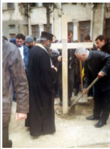
альное воплощение. С благословения Патриаршества Грузии это строительство объявлено истинно церковным делом. Активное участие в строительстве принимают ученики школы, педагоги, родители, представители общест-

В «Карту банки» открыт счет 4310613608. Обращаемся с просьбой ко всем помоч нам в этом святом и радостном начинании. Для ОРДИНОНИКЦЕЗ Заместитель директора 24-й средней школы по учебной части