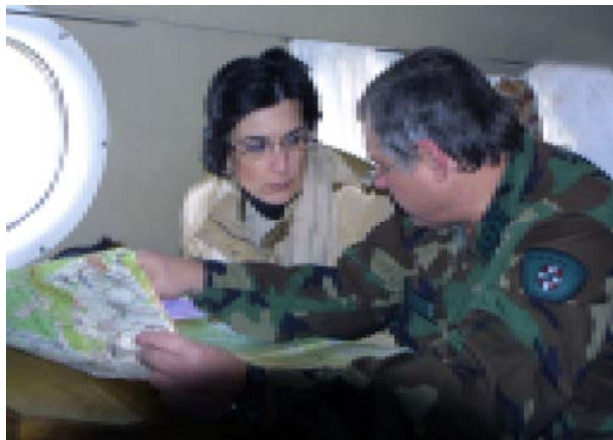
Государственная информационная служба

границе. Особое стратегическое значение здесь заключается в том, что он находится в непосредственной близости к границе и, исходя из этого, здесь нужна повышенная бдительность, чтобы вооруженные лица не пересекали границу. Грузинские пограничники имеют ежедневные контакты со своими российскими коллегами, и ситуация здесь полностью под контролем. Тут же необходимо отметить, что представители Миссии ОБСЕ постоянно ведут обход границы. Последним пунктом этого визита было Панкисское ущелье в Ахметском районе. Здесь, в селе Дуиси, Нино Бурджанадзе встречали упомянуемый президентом в регионе Кахети Тамаз Хидашели, министр внутренних дел Грузии Гия Барамидзе, министр госбезопасности Валерий Хабурдзания. После осмотра близости дамбы внутренние войска исполняющая обязанности президента провела встречу с местными жителями, ознакомились с теми проблемами, которые существуют на сегодня в Панкисском ущелье. Ей выпала возможность услышать слова благодарности в адрес новой власти, так как, по словам местных жителей, с момента смены власти в регионе нет фактов разбоя и грабежа. Они выразили свою поддержку правительству в связи с приближающимися президентскими выборами.