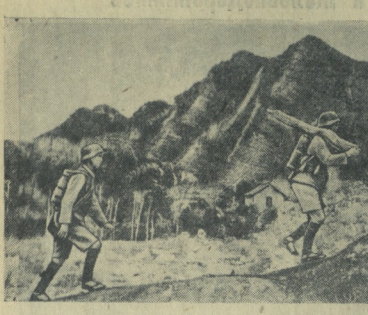
Бойцы китайской национальной армии, оперирующие в японском тылу в провинции Шаньси.