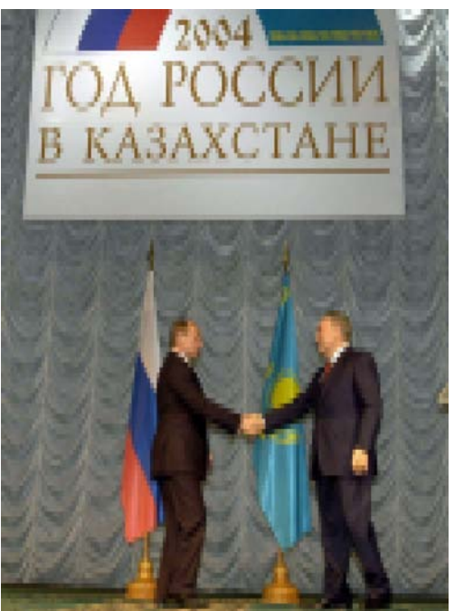
экономик. Двухстороннее взаимодействие России и Казахстана. Примером годное сотрудничество в этой области становится надежным фундаментом для всего комплекса отношений

ке, извлекаемые запасы здесь составят более 100 млн. тонн условного топлива. Тюб-Караган занимает площадь свыше тысяч кв. км и расположен в 40 километрах от порта Баутино. Ущасток - Аташский это свыше 8 тыс. кв. км в 80 км от Баутино. Восточная его часть после проведения дополнительных изысканий не исключает возможности обнаружения других весьма перспективных месторождений. Общие затраты на реализацию этих проектов могут составить свыше $ 3 млрд. Срок действия проектов по Тюб-Карагану составляет 40 лет. По мнению президента НК «ЛУКОЙЛ» Вахита Алекперова, осуществление этих проектов является важным этапом стратегии «ЛУКОЙЛ» в Казахстане как приоритетного региона международного деятельности компании. В нынешнем году стартует и другой российско-казахстанский проект на месторождениях Курмангазы, Хвалынское и Центральное. С российской стороны в него вовлечена НК «РОСНЕФТЬ». Успешно развивается и сотрудничество электроэнергетики двух стран. С 2000 года энергосистемы двух стран работают в параллельном режиме. Растет обмен и транзит электроэнергии. Практически выложены все мероприятия по организации совместного российско-казахстанского предприятия на базе Омбайтауской ПРС-2. Топливо-энергетическая сфера давно и прочно стала и в России, и в Казахстане основой достаточно высоких темпов роста национальных