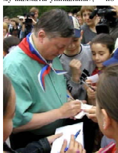
дьякожил результаты турнира Анатолий Карпов.

В конце прошлого года в Ярославле состоялся детский шахматный турнир, куда съехались ребята из областей центра России. Им выпала удача стать участниками сразу нескольких игр с самим Анатолием Карповым. «В шахматном последние могут сразиться люди разных возрастов. Попробуйте в этом году, там в боксе или борьбе. Неподходящих для шахмат уникальных», — по-