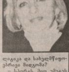
ფაქტორი და სახელმწიფო მედიკოსი