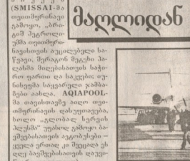
ღიმილის ღრუბი, ღიმილის ღრუბი, ღიმილის ღრუბი...