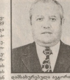
დაცლილია მრავალი ორთონი, მელი, სახე-სახელები. 1997 წელს საზოგადოებაში მისი მხარეა...