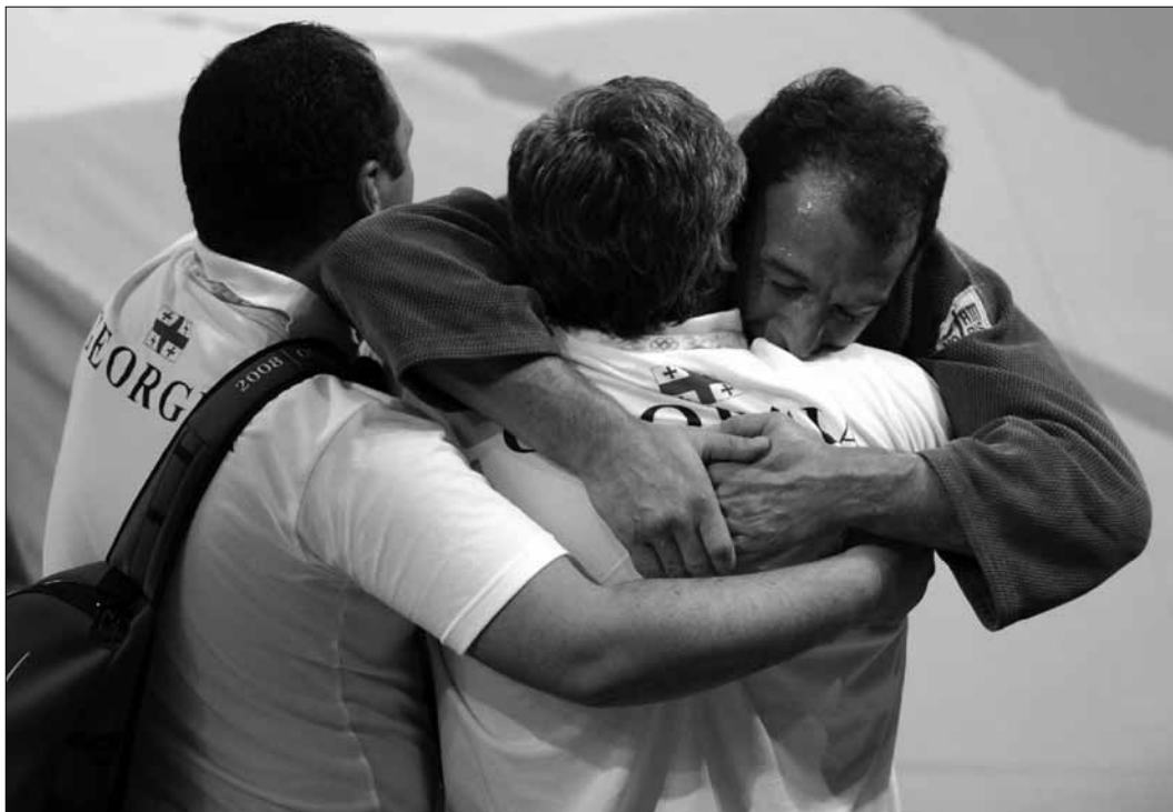
ფინალი მოგებულა, ირაკლი ცირეკიძე ოლიმპიური ჩემპიონია