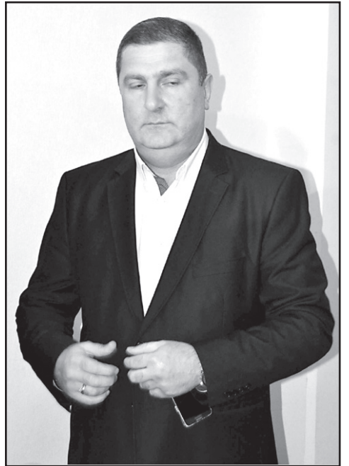
ვინმეს წარმოუდგენია. ზოგიერთი ყოფილი ნაციონალი კანდიდატის დასახელება დიდ უკმაყოფილებას იწვევს.

— მიხილ მატყვარიანის თქმით, „ქართული ოცნებაში“ ახლა იმაზე მეტი ნაციონალია, ვიდრე