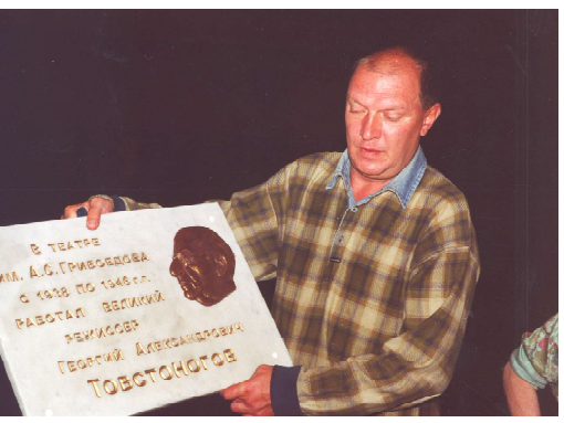
зрителей. Президент Грузии - человек прагматичный, умный и не пропустит этого события.

«Русский клуб» объединяет всех тех, кому дороги сегодня отношения Грузии и России. Членами нашей