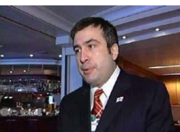
Завершился двухдневный официальный визит президента Грузии в Словакию.