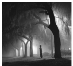
Иллюстрация к статье «Человек-мак на корабле»

Приснившаяся женщина-гном должна вас насторожить, потому как настоящая женщина уже с утра начнет выпадать перед вами разные колдуньи, капризничать и хныкать. Придется приложить всю свою изобретательность, чтобы сохранить хорошие отношения.