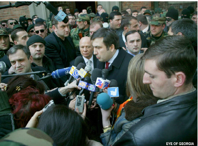
EYE OF GEORGIA