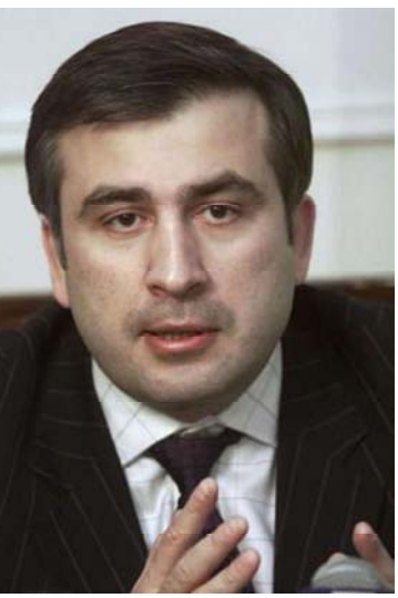
Грузия не собирается осуществлять боевые действия в зоне грузино-осетинского конфликта.

конфликта 500 военнослужащих и тяжелую технику. Но это делается только для того, чтобы защитить мир», - отметил Михаил Саакашвили.