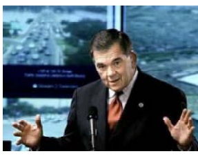
имеющего полномочия менять дату проведения федеральных выборов. Об этом заявил председатель недавно созданной Комиссии по содействию выборам Дефорест Соарис.

«В целях обеспечения безопасности выборов мы изучим все возможные варианты развития событий», — заявил пресс-секретарь министерства внутренней безопасности Брайан Росскас. Опасения руководства США о возможных терактах основаны на многочисленных предп-