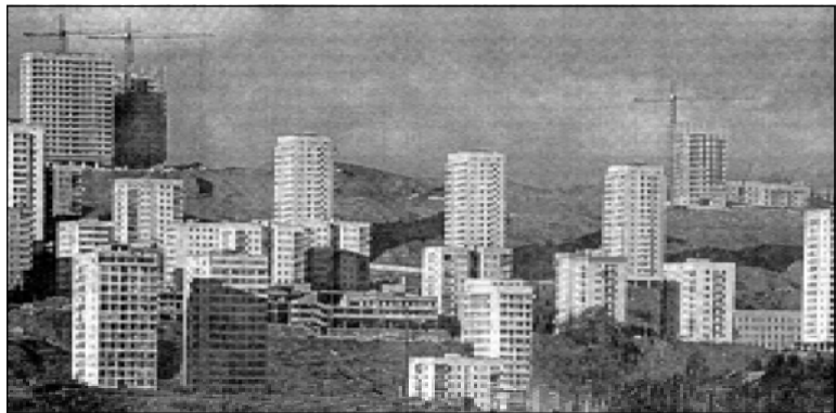
Вид на город Тбилиси с высоты птичьего полета.

ствах мира. Одновременно компания занимается вопросами бухгалтерского обслуживания, развития человеческих ресурсов, маркетинговыми исследованиями, консультированием индивидуальных владельцев, архитектурным дизайном, строительством, проектированием и финансированием. Генеральным подрядчиком "Marriott Tbilisi" избрана шотландская строительная компания "Morrison International Constructions". Гостиница "Marriott Tbilisi" должна войти в строй в марте 2001