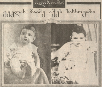
ალბომი ეკვლავ რაიკე აქვს ხასხოვარი