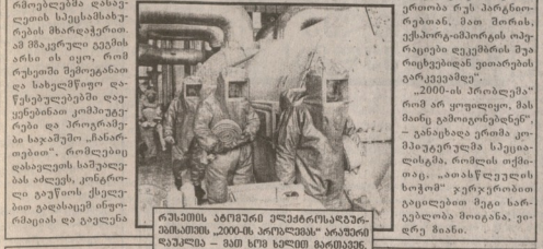
რესპუბლიკის პრეზიდენტის... 2000-ის პრობლემა...