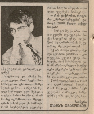
ნაღვლიანი მდინარე... მთელი მთელი მთელი...