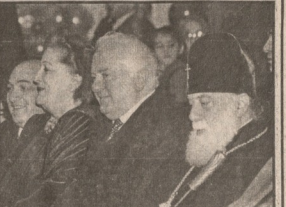
საქართველოს პრეზიდენტი მიხეილ სააკაშვილი