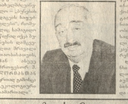
„და სეკრეტოვლობა მეტვას უღელი“