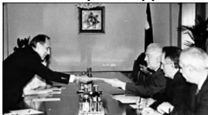
28 июня Президент Грузии Эдуард Шеварднадзе принял заместителя министра иностранных дел Турции и выразил уверенность

в том, что осуществление проектов регионального масштаба будет способствовать развитию партнерских отношений между государствами - их участниками и окончательно утверждению стабильности в регионе. Коснувшись перспектив мирного урегулирования конфликта в Абхазии, гость еще раз подтвердил позицию властей Турецкой Республики в связи с территориальной цело-