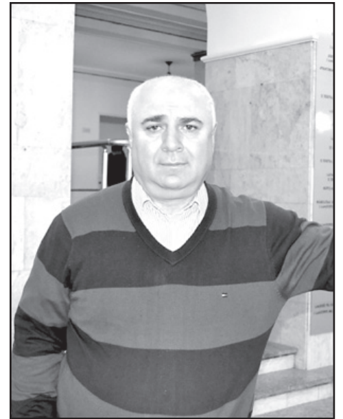
არ ყოფილა მაღალი. ეკონომიკისა და პოლიტიკის ანალიზის ცენტრის გამომცემის შედეგების თანახმად, ბურჭულაძის რეიტინგი ბოლო ერთ თვეში კიდევ უფრო დაეცა.

— მისი იმიჯი მანამდე ბევრი გარემოების გამო შეილახა. ბურჭულაძემ ბლოკი შექმნა ისეთ პოლიტიკოსებთან, რომ ნაციონალებთან მის კავშირზე კითხვებიც აღარ უნდა დარჩეს. ეს ბლოკი იგივეა, რაც ნაციონალური მოძრაობა. რაციონალი და ჯაფარიძე ერთმანეთისაგან არაფრით განსხვავდებიან. ბურჭულაძის რეიტინგი კი ადრეც