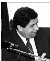
В ходе переговоров стороны обсудили те-

кущее состояние расчетов грузинских потребителей за получаемый ими природный газ и вопросы, связанные с газоснабжением Грузии на предстоящий осенне-зимний период. Помимо этого, обсуждались возможности "Итеры" в приватизации АО "Тбилизгаз", а также совместные проекты с Международной газовой корпорацией Гру-