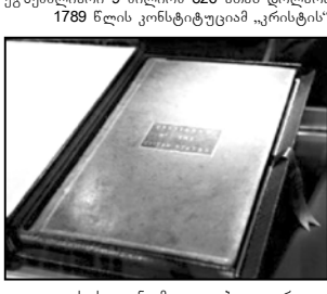
1789 წლის კონსტიტუციის „კრისტის“ ეგზემპლარი

ამერიკის 1789 წლის კონსტიტუციის უნიკალური ეგზემპლარი, რომლის მფლობელი პირადად ამერიკის პირველი პრეზიდენტი ჯორჯ ვაიხინგონი გახლდათ, გაიყიდა. ნიუ-იორკის „კრისტის“ აუქციონზე კონსტიტუციის პირველი ეგზემპლარი 9 მილიონ 826 ათას დოლარად გაიყიდა.