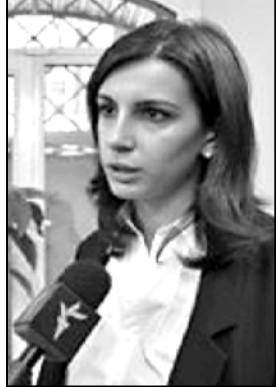
რაღაც შეიძლება სწრაფად მოხდეს, ეს იქნება ჩვენი მოთხოვნა... ადამიანის ერთ-ერთი მნიშვნელოვანი უფლებაა, რომ ინფორმაცია მიიღოს რაზეც საერთაშორისო საზოგადოება აპელირებდა, ამ შემთხვევაში თუ ეს პროცესები განხორციელდება, იქნება გარანტია, რომ ამოწმებული სრულად იქნება ინფორმირებული...