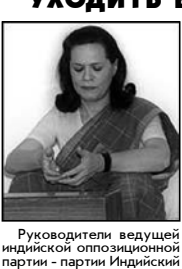
Руководители ведущей индийской оппозиционной партии - партии Индийский национальный конгресс -

обратились к Соне Ганди, индийскому политику, рожденному в Италии, с просьбой отозвать свое заявление об отставке председателя партии. Но, несмотря на сложную и мощную машину, как Сона Ганди изменили свое решение. Сона Ганди подала в отставку после того, как три видных политика обратились к ней с просьбой отозвать свое решение. Сона Ганди подала в отставку после того, как три видных политика обратились к ней с просьбой отозвать свое решение. Сона Ганди подала в отставку после того, как три видных политика обратились к ней с просьбой отозвать свое решение.