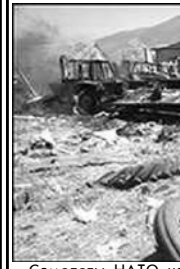
Самолеты НАТО нанесли очередной массированный ракетно-бомбовый удар по целям в Югославии.

Югославского президента Милошевича и обеспечить возвращение косовских беженцев домой. Близ завершающегося в гостинице Великобритании помощи в восстановлении балканского региона после окончания войны. Правительство Болгарии выразило поддержку военной кампании НАТО, однако мало болгар вы-