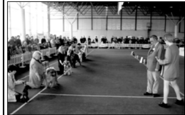
Эти слова принадлежат великому собаководу Конраду З.Лоренцу: «В почти кинематографический быстрой темени нашей жизни современный человек...

приятного подтверждения того, как семечки сади четыре ноги”.