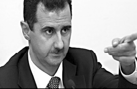
დაბარეზი ხელისუფლება არ შეიძლება დევნილობაში ჩამოყალიბდეს...

სირიის დიქტატორად ცნობილი პრეზიდენტის ბაშარ ასადის განცხადებით, ის ქვეყნის დატოვებას სადაც წასვლას არ აპირებს.