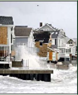
ტბა, რომლის სიჭარბე საათში 100 - კმ-ს აღწევს.

შეუღლად: 1. „ვეფხისტყაოსნის“ პერსონაჟი; 2. მაკრონიზაგან დამზადებული იტალიური კვირი; 3. პრეზიდენტის რეზიდენცია რომში; 4. უღელტეხილი კავკასიაში; 5. დეკორატიული ჯიშის, ხუჭუჭუნე ვიანი ძაღლი; 9. უოლტ დისნეის სრულმეტრე ანიმაციური მულტფილმი; 10. კავშირი, გაერთიანება; 14. სახელმწიფოს საკანონმდებლო ორგანო; 15. ფსონების ამკრეფი ტოტალიზატორი; 16. უბანი თბილისში; 19. დიდი ბუ. 20. თანამედროვე ქართული მოქანდაკე; 21. სათათბირო ორგანო მართლმადიდებელ ეკლესიაში. თარგუმად: 6. მომავლის გეგმები; 7. ობობას ძველი ქართული სახელწოდება; 8. ძალისხმობის იარაღი; 11. ქართული ხალხური ცეკვა; 12. რგოლისებრი მარჯვის კუნძული ოკეანეში; 13. ტკბილეულის მწარმოებელი ქართული ფირმა; 17. მატარებელი იუმორისტული მოთხრობა; 18. ქართველი მთლიანობის ოლიმპიური ჩემპიონი; 22. ძველებური ფრანგული ოქროს ფული; 23. ფრანგული ყველი; 24. თურქმენების დედაქალაქი; 25. უფროსი მოსამართლე ძველად. შეადგინა თეოპოლიტოლოგი