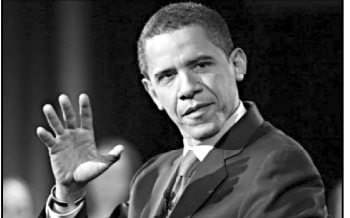
გაკაკრითიკა. ფრანს პერესის ინფორმაციით, სკანდალური საიტის 'ვიკილიქსის' დაბრუნებელი ფულიანსაჩივრები...