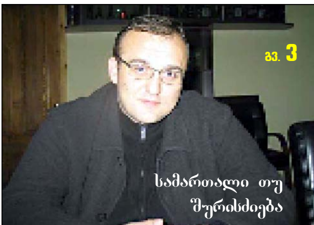
სამართალი თუ შურისძიება