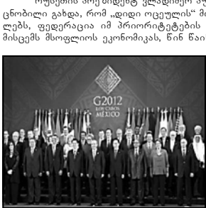
რუსეთის პრეზიდენტ ვლადიმერ პუტინის განცხადებით, მას შემდეგ, რაც ცნობილი გახდა, რომ „დიდი ოცეული“ მორიგ შეკრებას რუსეთი უხელმძღვანელებს, ფედერაცია იმ პრიორიტეტების დასახვის შეუდგა, რაც საშუალებას მისცემს მსოფლიოს ეკონომიკა, წინ წაიწიოს.

„ჩვენს როლს გვდავა იმაში, რომ შევიქმნათ რუსეთის რეპუტაცია, რომელიც დააჩქარებს და შექმნის ახალ სამუშაო ადგილებს. ამისთვის იმ ტექნიკისტიკების სტიმულირება, ნდობა და მსოფლიო ბაზრებზე ტრანსპორტის ევოლუციური რეგულაცია საჭიროა“, - განაცხადა პრეზიდენტმა.