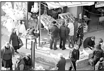
რომ საპატროლო პოლიცია გარემოვაჭრებს მერის სახელით უკრძალავს ვაჭრობას, უფლებამოსილებით, უკვე მოზადებულია კაპონი

მნიშვნელოვანია. საზოგადოება ბოლო ხანებში არაერთხელ გახდა მიწვე გარემოვაჭრების და ბაზრობებზე მოვალეა დაპირისპირებისა. ეს უკანასკნელი ამბობენ, რომ გარემოვაჭრები მათ კლიენტს ართმევენ და ხელისუფლებამ უნდა იზრუნოს მათ „აღაგვავებ“. გუშინ, საღვთის მოედანზე, „ბაგუთა სამარისთან“ გარემოვაჭრებმა გარემოვაჭრების დაშვება მოითხოვეს და ხელისუფლებას თხოვეს მიმართეს ახალი წლის ნინა პერიოდში გარემოვაჭრების ნება დაეროვნ. სხვათა შორის, გასულ წელს სახალხოდაც ასეთი ვაჭრობა დაშვებულ იქნა საღვთის ტერიტორიაზე, გარემოვაჭრები პაჭრობა უფრო მოპრობასაც ამოტყდნენ. უფლებამოსილებით ლაზარტოვილი გუშინ გარემოვაჭრეთა ინტერესებს იცავდა და ამბობდა,