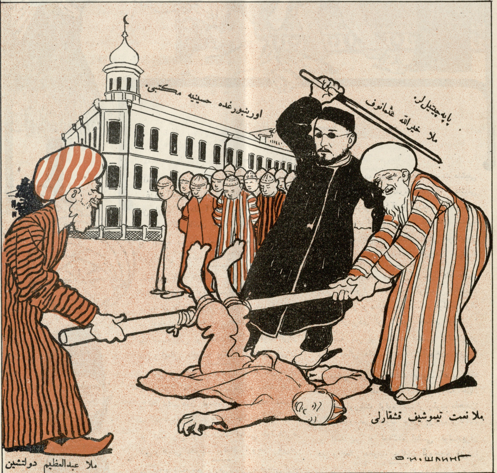
ووروک، ووروک، بو گون عبدالرحیم دامینوف معلمی ایسته مینهن شاگردلر صباحده دییه جا کله که پاپه چیتیل لری ایسته میریک.

№ 11. Цѣна 12 к. МОЛЛА НАСРЕДИНЪ قیمتى ۱۲ قېك ۱۱