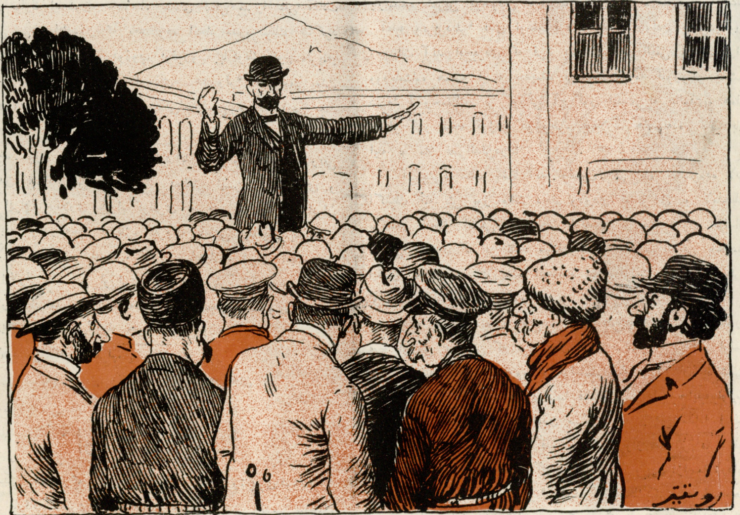
ایرمنلر قاتالیقوسک ایروانه گلمگی مناسبی ایله میتینگ ایلبورلر.