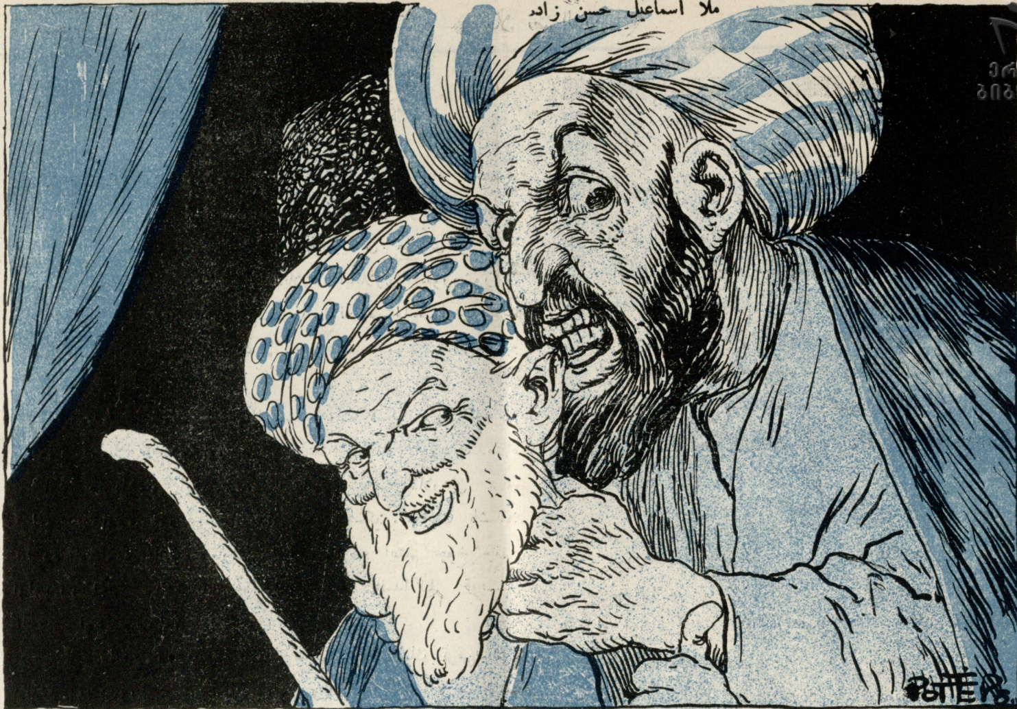
گوندگ پر گونی ملا نصرالدینک یولی دوشی ولادیقا فقا ز میشه لرینه ... (ما بعدی وار)