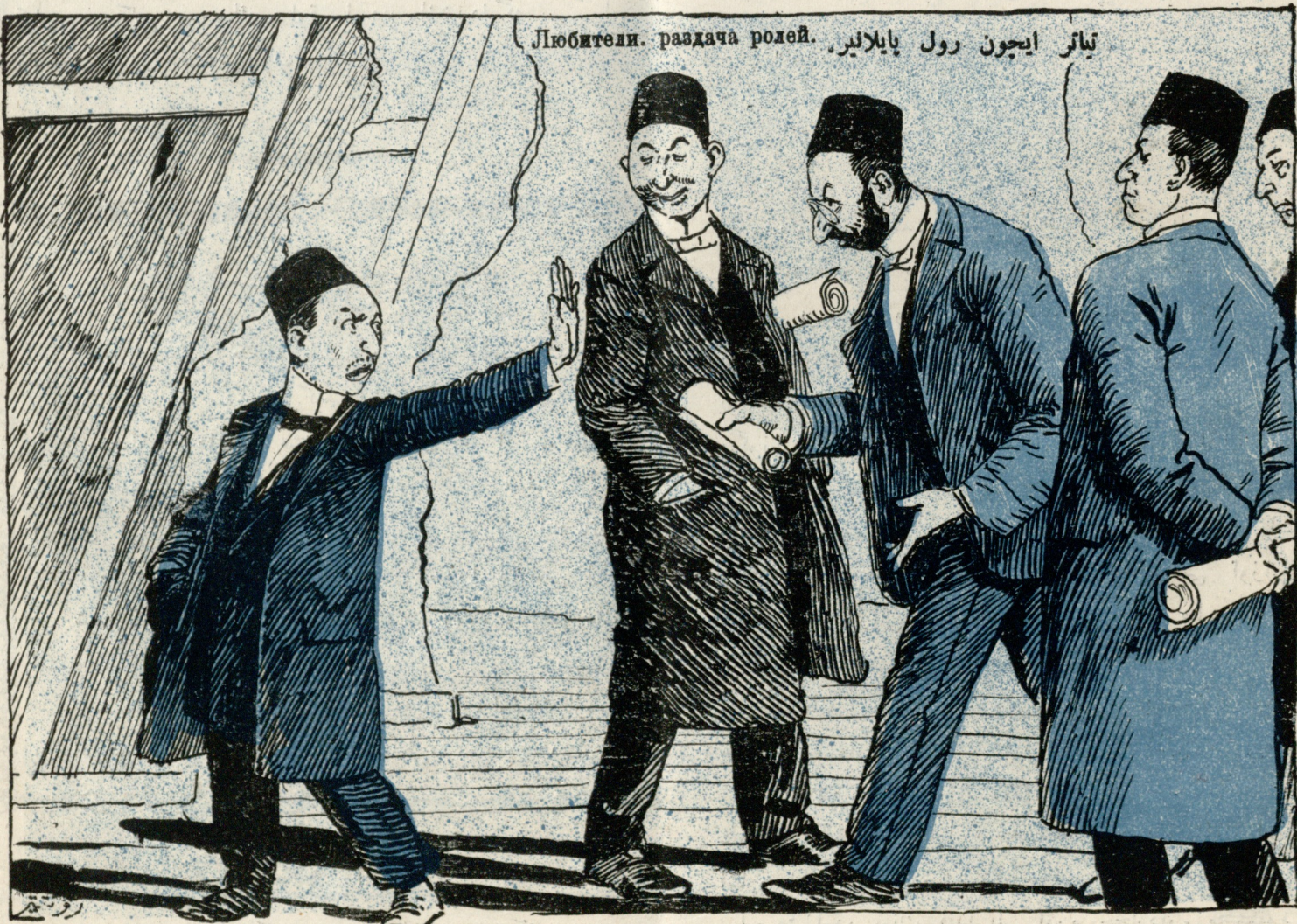
تئاتر ایچون رول پایلا لیر. Любители. раздача ролей.