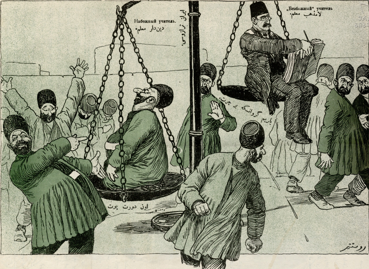
— آ کیشی بو لامذهب معلمری نیه چخاردوب قومیریق که یازاق مرندن مؤمن معلمار گسون.