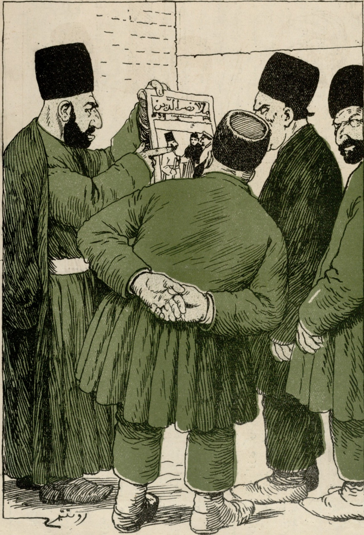
سینہ اللہ بر باخاک گورکھ بو ملا نصرالدین خلقی نیچہ تاحق بر، آرو ایلپور، ہرگاہ بوکا ایندی لکدہ بر علاج