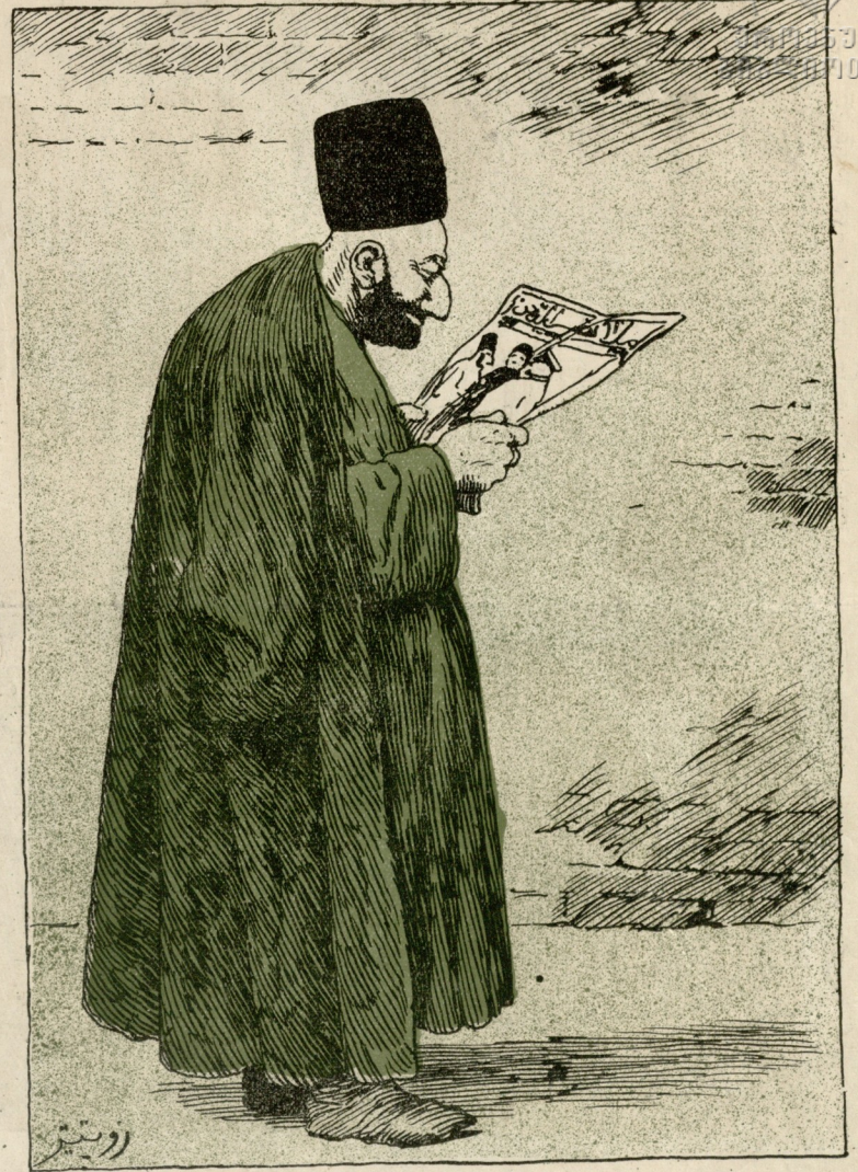
ظالم اوغلی نہ یریندہ چکوب! آخ! قلکھ قربان اولوم!.. (تک لکدہ)