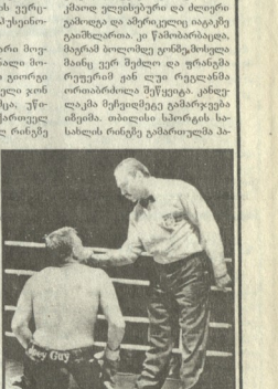
საბავთილონო შაბლეს სახაიდიონო სანაინაინაილონი დარბაზოშაბლესი 1999-2000 წლის და სხვა დირინდელი ლეზონი კურსდარბაზო...