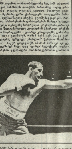
მეჩვიდმეტე გელეგება - შემოდგომით