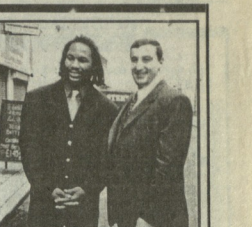
საბავთილონო შაბლეს სახაიდიონო სანაინაინაილონი დარბაზოშაბლესი 1999-2000 წლის და სხვა დირინდელი ლეზონი კურსდარბაზო...