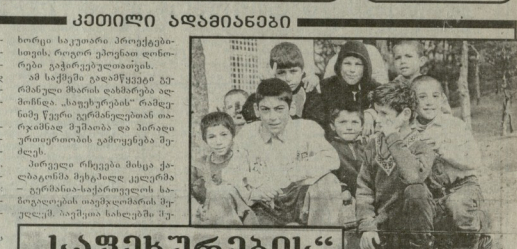
პრესამბლამი უკრაინის სახელმწიფო მთავრობის წევრები