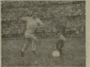
ორი მომენტი განვლილი მატჩიდან თბილისის „დინამოსა“ და ქუთაისის „ტორპედოს“ შორის.