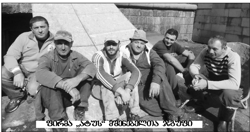
ზირაბ „ატუს“ შემხანაფლია ჯგუფი

მიმდინარე კვირის 22 ოქტომბრიდან ოზურგეთის სახელმწიფო თეატრის დიდი სცენა და შენობის დიდი ნაწილი საექსპლუატაციო კომპანიის „ქართუ“ და სამხრეთ-აღმოსავლეთ კომპანიის „ატუს“ მხრით ბელთა განკარგულებაში გადადის. მანამდე თეატრი ერთგულ მყურებელს და პატარებს კიდევ სამჯერ ამ