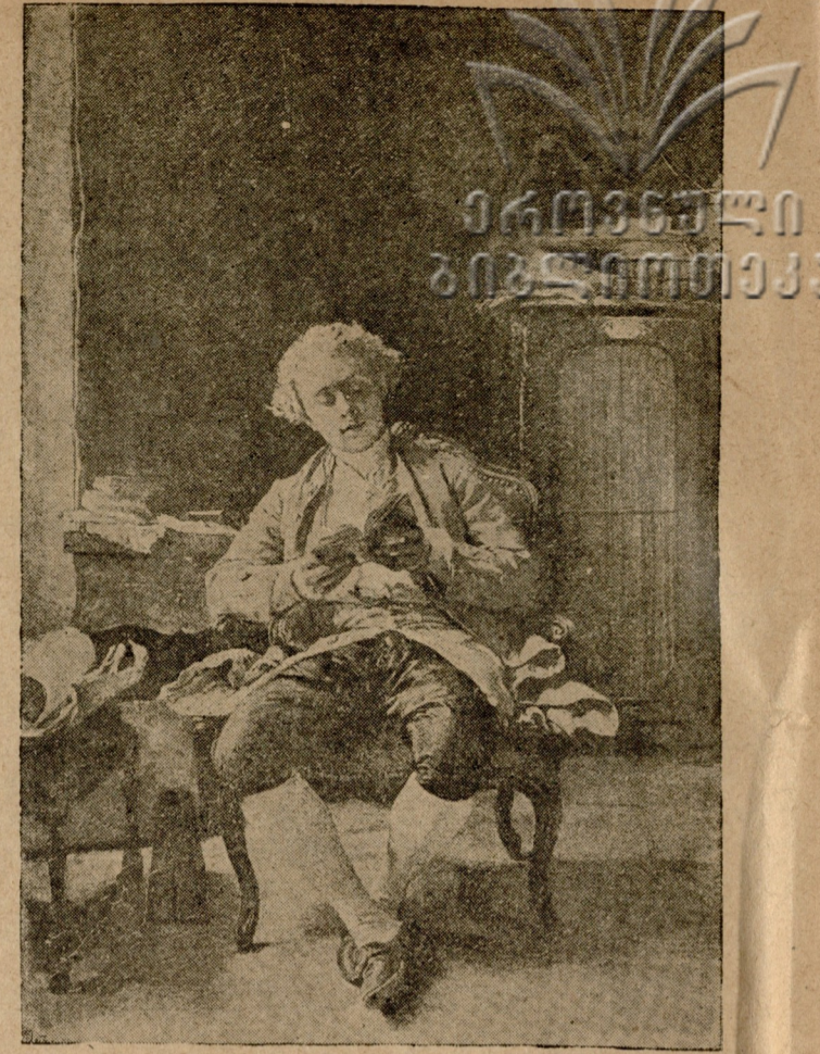
მესსონიე (მე 19-ე საუკუნის ფრანგი მხატვარი) — „წიგნის კითხვა“

1932 წლის განმავლობაში სახელწოდებული გამოცემა მარტო მხატვრული მწერლობის დარგში: 58 სახელწოდება, რაც უდრის 9.760 გვერდს, 614 საავტორო ფორმას, 1.962.200 ამონაბეჭდულ ფურცელს. ტირაჟი 245.700 ცალი.