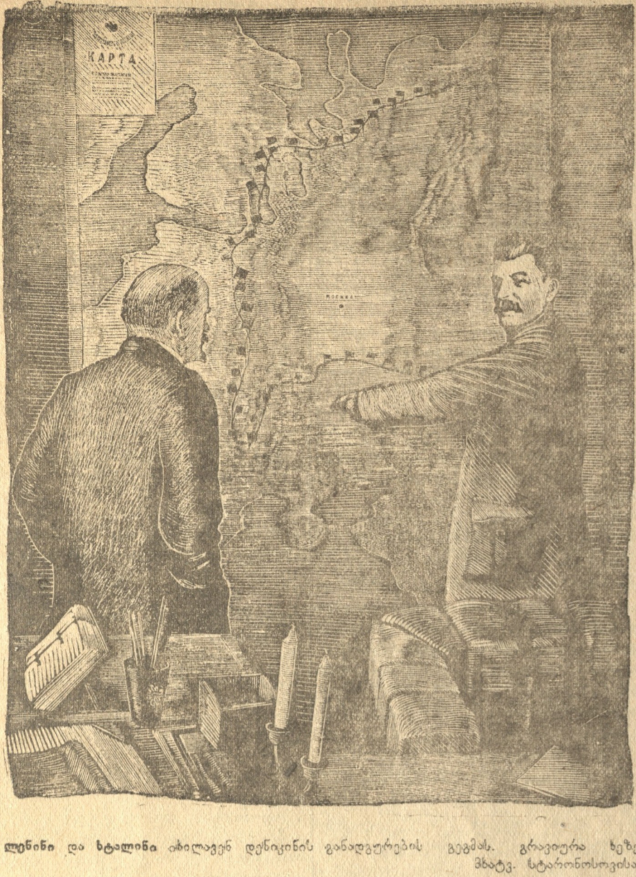
ლენინი და ხელმძღვანელები დიპლომატიის განსაკუთრებული მუშაობისას. მარჯვნივ ლენინი და ხელმძღვანელები