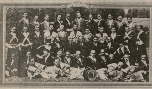
მეორე მსოფლიო ომის დროს გვევლინა ჩართულებიანი ცნობილი ლეგარმა და...