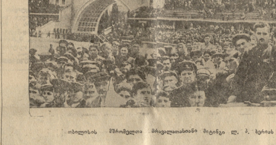
თბილისის მშრომელთა მრავალათასობანი მიიღეს ლ. პ. ბერიას სახ. ილინოს სტადიონზე.