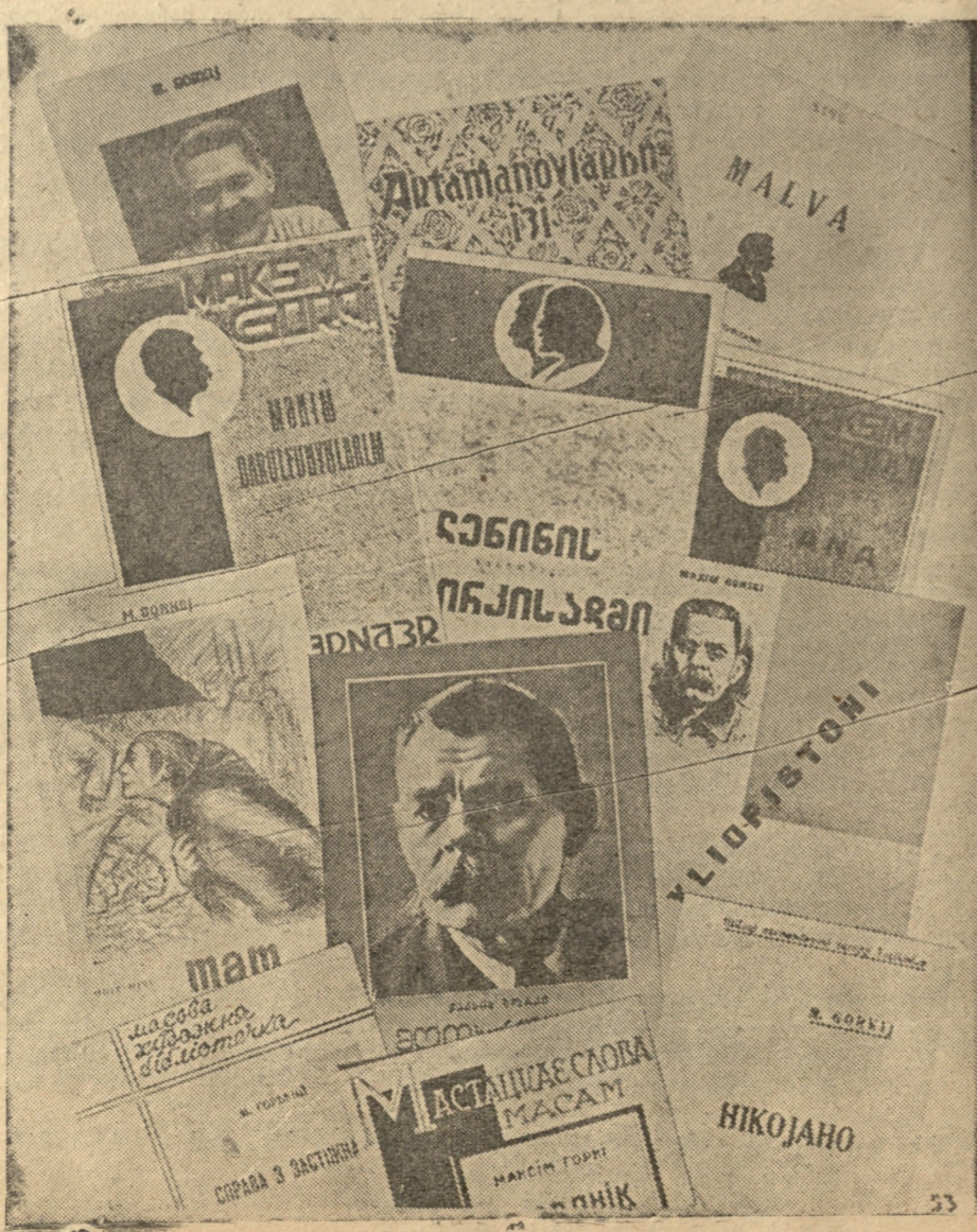
მ. გორკის წიგნები საქართველოში, ხალხთა ენებზე