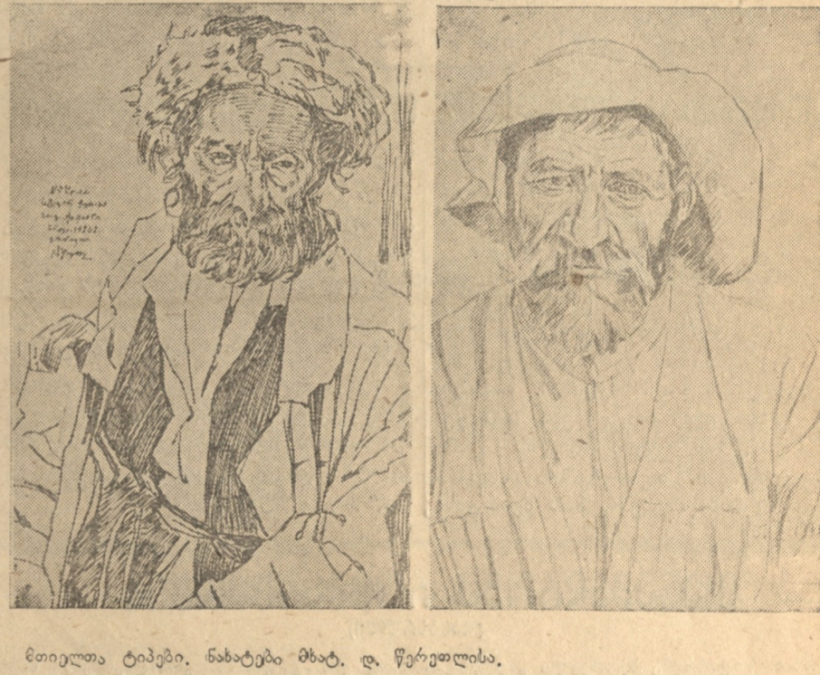
ნიკოლა ტრეპე, ნახატები მხატ. დ. წერეთლისა.