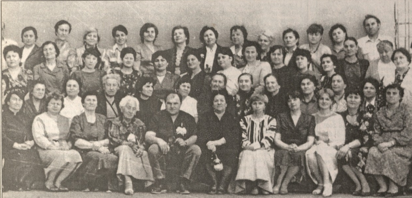
თბილისის მე-4 საზღვაო სკოლის პედაგოგები. გადგებულია 1987 წლის 29 მარტს.

შეგახსენებთ, რომ სურათების გამოქვეყნება უფასოა. ტელ.: 99-66-10.