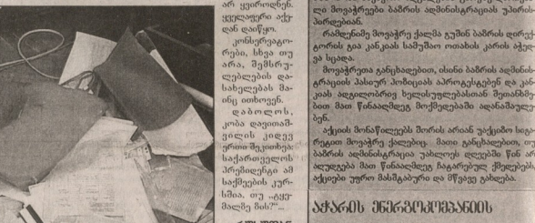
ავტომობილის მუხრუჭების დაზიანების შემთხვევაში...