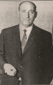
საქართველოს მთავრობის განცხადება

2000 წელს დაიწყო ა. ივანიშვილი მუდმივად დაიწყო კაპიტალიზმის სახელის თანახმად (1985-2000 წ.) ანტი-სისტემის თანახმად (1985-2000 წ.)