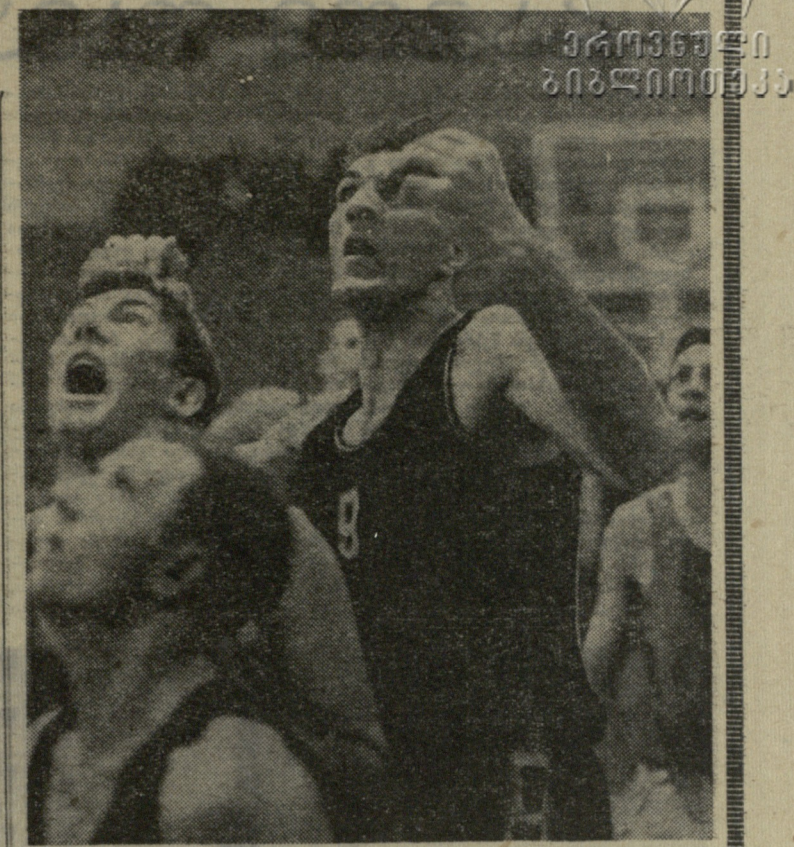
არის თუ არა...