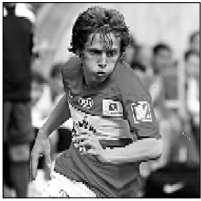
ევროასტუმბე დებიუტი ჰქონდა ჩემპიონატის ლიგაზე ლონდონის „ჩელსის“ წინააღმდეგ.

მედი ცნობილი გახდა, რომ ჯანო ანანიძის კარიერას „არსენალის“ თავაკი არსენ ვენგერი აკვირდებოდა. მის შესახებ ცნობებს ავრკვებდნენ „იუვეტუსის“, „მილანის“ და „სევილიას“ საუბრები, რაც თავისთავად მეტყველებს მისი ტალანტის მსოფლიო მდებარეობაზე.