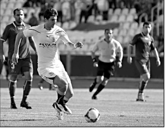
ზამთრის პაუზა საქართველოს ჩემპიონატში მონაწილე გუნდებისთვის მოსაზრებელი პერიოდია...