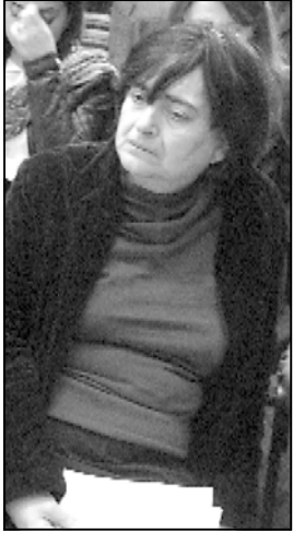
მეზა კი არაა, არამედ დღევანდელი პოლიტიკის რეალობაა.

მოზადგენილება თქვენს ტერმინებს მნიშვნელობა არა აქვს, ტერმინებს ნუ ამოვიჩინებთ. მაშინ ლაბარაკი იყო სწორედ საერთაშორისო ტრიბუნების გამოყენებაზე ოკუპაციის საკითხების წინაშე მიმდინარეობს. ეს ტერმინების ამოჩე-