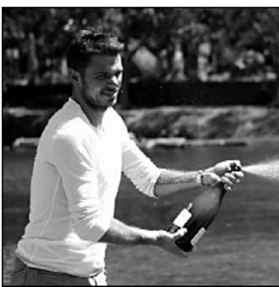
მესამე ნომერი მოგბურთელი გახდის, ამ კითხვას ველოდი. ალბათ, ჩემგან რიტინგის დანიშნულების სურვილის გამოთქმას უკლით, მაგრამ კარგად მესმის, რომ ეს ურთიუესად აღსასრულელებელი საქმეა და არც ახლო მომავლის პერსპექტივაა.

— მეც კი გაკვირვებულნი ვიყავი, თუ რა მაღალ დონეზე დავიწყე