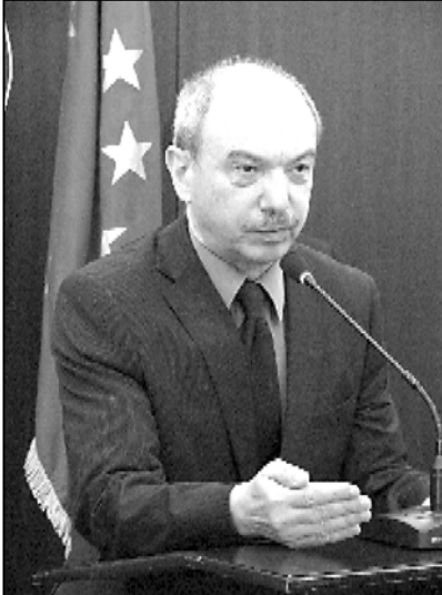
შორდებოდა მუხროვანის ე.წ. ამბოხი?