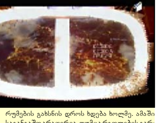
რუმების გახსნის დროს ხდება ხოლმე. ამაში საგანგაშო არაფერია, თუმცა რგოლების გარდა კიდევ იყო რამდენიმე უზუსტობა. ქართველი მოსახლეობის დიდი ნაწილის აღშფოთება გამოიწვია კომისიის და-

შესაბამისად, ის ვიდეო, რომელიც გახსნის ცერემონიალიზე გვიჩვენებს, აბსოლუტური სიყალბე იყო. არგონავტების საკითხი პირდაპირ კავშირშია საქართველოსთან და თუ რაში დასჭირდა რუსეთის გახსნის ცერემონიალიზე ამხელა ტყუილის გამოყენება, ეს თავად განსაჯეთ. ამ საკითხზე კომენტარი აუცილებლად უნდა გაკეთდეს, როგორც საქართველოს საგარეო საქმეთა სამინისტროს, ისე ქართველი ისტორიკოსების მხრიდან. პირველი შეცდომა გახსნის ცერემონიალიდან რამდენიმე წუთში მოხდა, როდესაც ოლიმპიური რგოლები არასრულყოფილად გამოიხატა სტადიონის ერთ მხარეს. სამართლსა და კიდევ იყო რამდენიმე უზუსტობა. ქართველი მოსახლეობის დიდი ნაწილის აღშფოთება გამოიწვია კომისიის და-