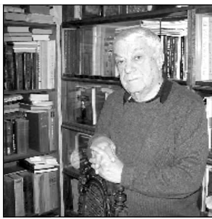
გაკრიტიკებს, ამას მხოლოდ სიყვარულით გააკეთებს.

— მისი განცხადების გაგება ორნაირად შეიძლება. რესპუბლიკელებმა სათავისოდ გაიგეს, იფიქრეს, ჩვენი დრო დადგა და შეუტეეს ეკლესიას. მე ვფიქრობ, რომ ივანიშვილი მართლაც ამბობს და ეკლესიის მხოლოდ სიყვარულით გააკრიტიკებს. კაცი, რომელმაც სამება ააშენა, არა მგონია, მართლმადიდებლობის წინააღმდეგი წავიყოს. ახლა ის ამბობს, კრიტიკა საჭიროა. ამაში ვერ დავეთანხმები. თუმცა ახალი რუსული ურბნისის კრების მოწვევა შესაძლებელია. დავით აღმაშენებლის დროს მეფეებმა დიდგვაროვნები იყვნენ, რომლებიც დავით აღმაშენებლის წინააღმდეგ გამოდიოდნენ. ამიტომაც ჩატარების წინააღმდეგ გამოდიოდნენ. იმ კრებამ ძალიან კარგად იმოქმედა ქართული ეკლესიაზე. დღეს ეკლესიას და ჩვენი უმნიშვნელო წინააღმდეგ მიმართული კრიტიკა არის შეტევა ქართულ ცნობიერებაზე. ეს არის მთავარი, თორემ იმაზე არაფერს ვიფიქრებ. რომ ნაკლი ეკლესიაზე არის. ქართული ცნობიერების სადარჯელად დღეს სწორედ ეკლესია დგას. ამიტომაც ზურაბიშვილებსა და მეჩაბიშვილებს ვთხოვ, ეკლესიაზე შეტევის თავი დაიხრებ. წინააღმდეგ შეეხებოდნენ, სავადრის პასუხს მიიღებენ, ისევე, როგორც ისინი, ვინც ლებტ პირების თავიერობის გამართვას აპირებს.