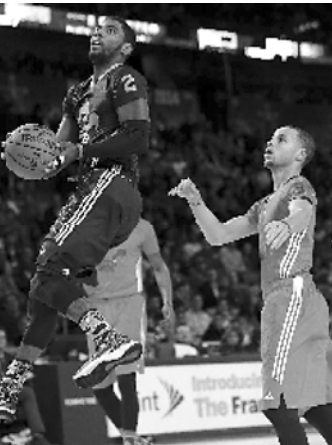
ორივემ 38-38 ქულა დააგროვა, მაგრამ ციტა დაკლდა უილს ჩემპიონის რეკორდამდე (42 ქულა), რომელიც მორეულ, 1962 წელს არის დაფიქსირებული.

სამუშაოების კონკურსი უკუნის უმატარესი უპირატესობა კიდევ უფრო თვალსაჩინო გახდა. თითქმის გადმუცვლი იყო, რომ მესამე ტიტულს დაეკავებინა, ანაც დურანტი მოიხივებდა, რომლებს უკვე არა ვეუილს-ენტონის წყველს არამედ ურთიან ეჯიბრებოდნენ. საბოლოოდ,