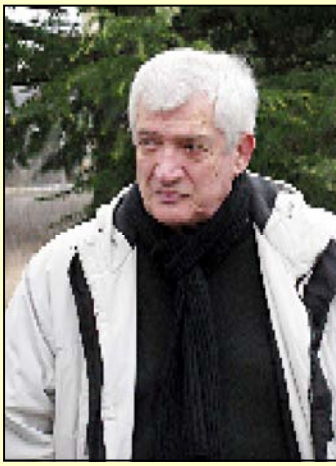
მელსაც არაფერი შეუქმნია ცხოვრებაში, არაფერი გაუკეთებია და გაბედა ასეთი სიტყვებით მიმართოს გიორგი შენგელაიას და თუნდაც მე. როგორც გაბედა სოსო ჯაჭვლიანმა, კაცმა, როგორც გაუკეთებია, ასეთი სიტყვებით მიმართა ბატონ გიორგი შენგელაიას და თუნდაც მე. არავის აქვს უფლება ისეთი სიტყვებით მიმართოს ისეთ ადამიანს, როგორც არის გიორგი შენგელაია. როგორც შენ, როგორც ჯაჭვლიანი, რომელსაც არასდროს არაფერი გაგაკეთებია და ბედაც იმხარო ისეთი სიტყვებით, რაც ახსენა! როგორც გაბედა სოსო ჯაჭვლიანმა, კაცმა, როგორც გაუკეთებია, ასეთი სიტყვებით მიმართა ბატონ გიორგი შენგელაიას და თუნდაც მე.

ქაბაძე ირეკაშვილი ქინთოევისთარი მერაბ თავაძე სააქციო საზოგადოება „ქართული ფილმის“ ირეკაშვილი მიმდინარე მოვლას ეხმარება. როგორც ხელფანისა საგანგებოდ გამართულ პრესკონფერენციაზე აღნიშნა, „ქართული ფილმის“ აქტივობების სწორედ სისთავა ჯაჭვლიანმა გადაწყვეტილებით გაიყვანა.