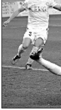
ახლოვდა მეორეადგილისანი და უფრო მეტადაა საჭირო თამაშის გამოხსორება.

მეორე ტაიმის შედარებით მშვიდი გამოდგა. დიდი ანგარიშით დანიშნურებულ ზესტაფონელები თამაში მათთვის სასურველ კალაპოტში გადაიყვანეს. თუმცა, მეორე ტაიმის რაღაც მო