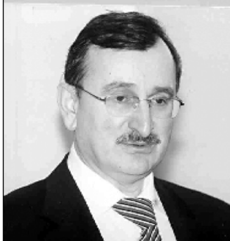
ტება 600 მლნ-იან გარღვევაში, რომელსაც თავი შემდგომ უკვე ლარის ვარდნაში იჩინა.

— მე არ ვიტყვი, რომ ეს არის არაქმედუნარიანი გუნდი. ასევე შევადგინებდი. ვიჭირობ, მილიანად ეკონომიკური გუნდის მუშაობა როგორც ფისკალური ანუ საბიუჯეტო, საჯანდაცლო, ასევე მაკროეკონომიკური, ასევე დარეგულირებადი მარეგულირებადი ეროვნული ბანკი მართავს, მე დავეწერე და 3-ს პლუსით. იმიტომ, რომ იყო სერიოზული ჩაჯანდაბოვებები, რაც გამოიხა-