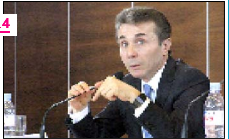
რა პროცესები დაიწყება თვითმმართველობის არჩევნების შემდეგ

გვ. 4 გაურიგდა თუ არა ლევან ვასაძე ბიძინა ივანიშვილს