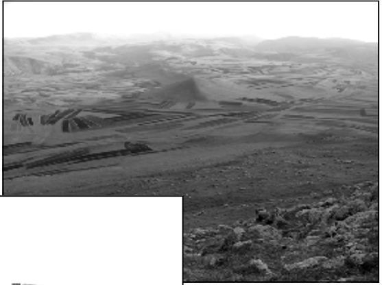
რაიონში, ისტორიულ სოფელ დუღუნაში, თანამედროვე სოფელ ბაღკანაში. მტკვრის მარჯვენა ნაპირზე, დრმა ხევიან სოფლის განაპირა, უნიკალური ძეგლის ნარჩენები. კედელი და ფსიხის მომჯდარეობა, კედლის შემოღობვა ქვის მოპირკეთების ქვებით, ინტერნული ალუა-ალაგ შემოწმება რამდენიმე ბერანგის ქვი, ეკლესიის ზომების 8.5x5.5 კედლის სისქე 0.80 მ.

ნისარეთის ეკლესია და „სტეფანო“, პანაჯის რაიონში, ისტორიულ სოფელ ნისარეთში, თანამედროვე სოფელ აუნუქიანთან, სოფლიდან დასავლეთით, დაახლოებით 700 მეტრზე, მდ.სამოთხისწყლის მარცხენა ნაპირზე, მდებარეობს ეკლესიის ნაშთი. შემორჩენილია წინაფასიის კედლის წყობა, თიხი კარვად გათლილი კვადრები, შემორჩენილი კედლის ზომა 130 სმ-ია.