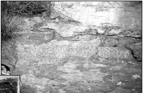
ნანის გაურკვევლი წარწერა. ერთი ამოკარგული წარწერა დაქარაქმებული ასომთავრულია შესრულებული. იგი ასე იკითხება: „ღმერთო, შენს რწმუნებულს კლდეზე განსწავლა სხვა ქართული წარწერებს კვალად“.

შოთა რუსთაველის ეროვნული სამეცნიერო ფონდის, 2013 წლის სახელმწიფო სამეცნიერო საგრანტო კონ-