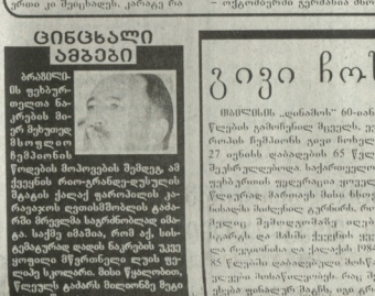
ბალოს გამოცდა - მხოლოდ ტატამზე